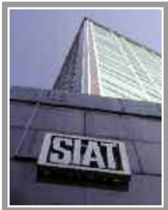
Qui a lato la foto della Sede SIAT, scattata da Via V Dicembre.