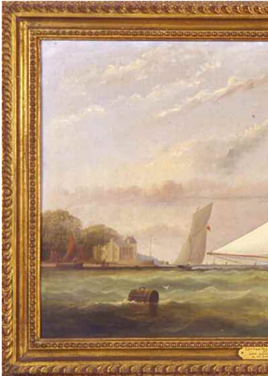
Arthur Wellington Fowles (1815-83) Cutter yacht EUFIN R.T.Y.C., 20 tons, off Cowes Castle (1861) Olio su tela - cm. 60x39,5