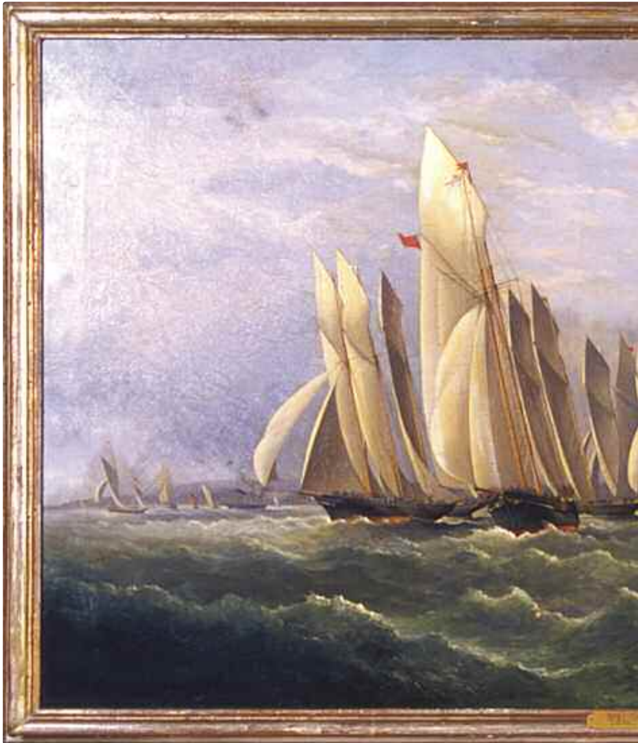
Arthur Wellington Fowles (1815-83) Yachts off Ryde starting for the match to Cherbourg, August 1865 by GALATEA (1865) Olio su tela - cm. 134x79