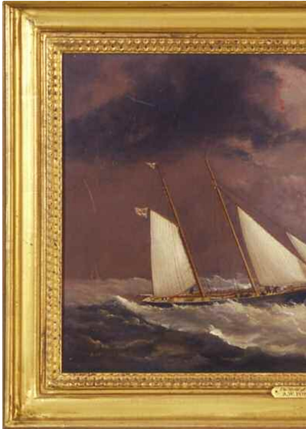
Arthur Wellington Fowles (1815-83) The MYRTLE off the Newarp light (1858) Olio su tela - cm. 44,5x29